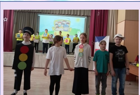
Гран-при 4 «Г» класс