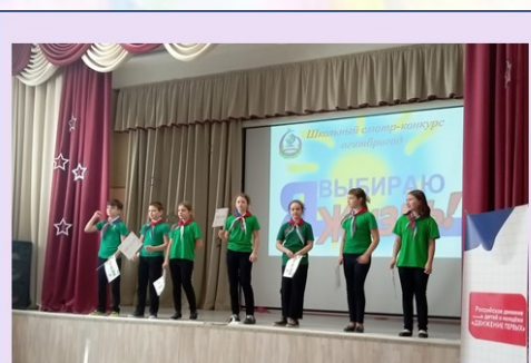
1 место - 5 «Г» класс