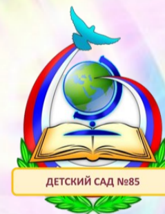
ДЕТСКИЙ САД №85