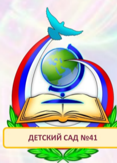
ДЕТСКИЙ САД №41