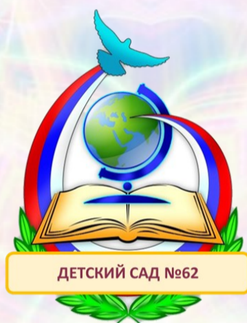
ДЕТСКИЙ САД №62