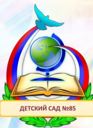
ДЕТСКИЙ САД №85

В детском саду № 85 осенние утренники закончились проведением веселой и дружной Ярмарки! Это мероприятие прошло в преддверии Дня народного единства. Воспитанники подготовительной группы погрузились в атмосферу русского народного гуляния, соблюдая обычаи и традиции. Во время подготовки к празднику ребята лучше узнали об особенностях народных костюмов народов России, познакомились с народными ремеслами жителей разных регионов России, играли в народные игры.