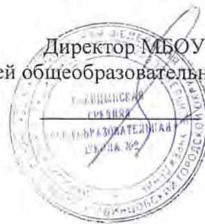
График дежурства администраторов МБОУ Голицынской СОШ № 2 с 09.01.2024 по 07.06.2024