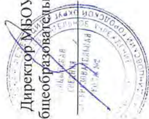
ГРАФИК ДЕЖУРСТВ (дежурный класс МБОУ Голицынская СОШ №2) на II полугодие 2023-2024 уч.год