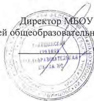
График дежурства администраторов МБОУ Голицынской СОШ № 2 с 09.01.2024 по 07.06.2024